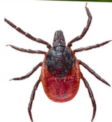
La tique adulte femelle (mord).